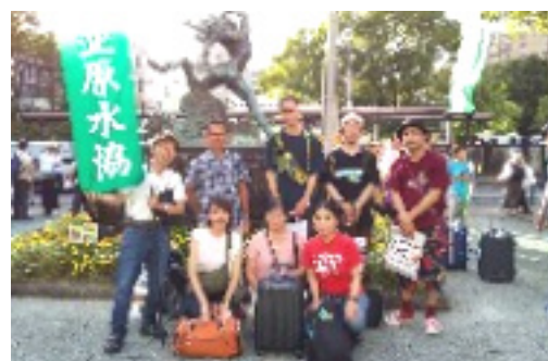
8月7日~9日、長崎での原水禁世界大会に参加した杉並支部代表と杉並のみなさん