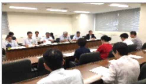
正面が区教委。手前が杉並支部の役員

【人事異動に関する杉並支部へのお問い合わせ】 Tel 3399-8719 19 (火・水・木の1時から6時) ※来る9月3日(火)の支部委員会でも学習会をします。