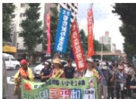
7月24日、平和行進。青梅街道を杉並公会堂から中野杉山公園まで歩きました。