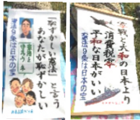
目を引いた杉並支部 Tさんのプラカード