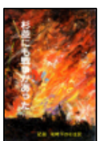
区民と教職員の手 で編集・1986年・