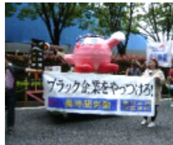
東京土建杉並支部のデコ。 「ブラック企業をやっつけろ！」 外国人職人さんもがんばる。