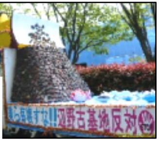
辺野古の海に土砂投入... 魚たちやチコちゃんに叱 られるぞ~