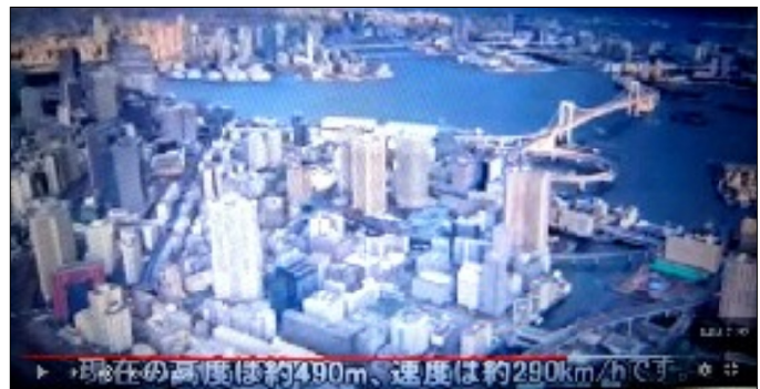
飛行機左側窓からレインボーブリッジ ルート 高度490M(スカイツリーより低い)