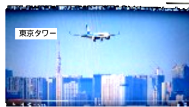
東京タワーよりやや高く、降下しながら羽田空港C滑走路へ向かう航空機。(羽田国際線ターミナルから撮影)