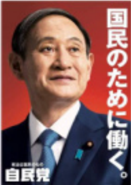
自分たちのために働く。 自民党