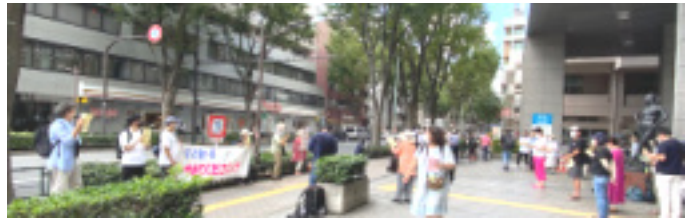
8月26日(木) 杉並区役所前での緊急要請行動

8月18日の東京都教育委員会では、出席した委員4人全員が反対しましたが教育庁は実施準備を続行しました。多くの自治体では、子どもたちの安全が保障されないとして参加を取りやめてきましたが、杉並をはじめ新宿・渋谷・八王子は実施しました。(約2万人) 8月26日は杉並区の教育委員会も開催されましたが、この件は議題にも報告事項にもならなかったそうです。「区長が決めた事項だから・・・」ということでしょうか。「希望という名の動員」「教育への政治的な介入」を感じてなりません。こうしている間に、千葉県では、教員、子どもの感染で、「連携観戦」を中止したという報道です。(8月30日 係)