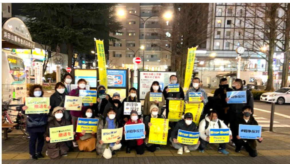
3月9日、6・9行動参加者の皆さん

去る9日(水)阿佐谷駅頭では、都教組杉並支部も参加している杉並原水協の6・9行動が行われました。これには30名を超える皆さんが参加。「戦争をやめよ」「核兵器絶対使えぬ」「9条を改悪するな」などと訴えました。150枚のチラシは直ぐになくなり、「核兵器禁止条約批准」には27筆、「憲法改悪するな」には20筆の賛同署名が寄せられました。