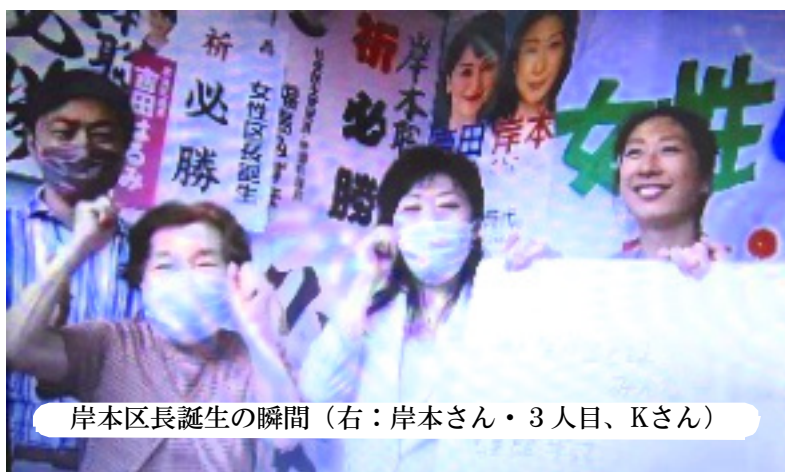
岸本区長誕生の瞬間（右：岸本さん・3人目、Kさん）