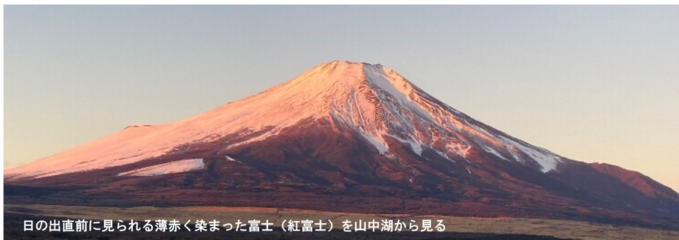
日の出直前に見られる薄赤く染まった富士（紅富士）を山中湖から見る

昨年2月24日から始まったロシアのウクライナ戦争は収束の出口が見えません。本当に心痛む毎日です。 ところが、岸田自公政権は、北朝鮮や中国の軍事的脅威を口実にして、憲法違反の敵基地攻撃能力（反撃能力）保持する、そのために軍事費をGDPの2%にして、大増税を行おうとしています。このようなことは許されるわけがありません。