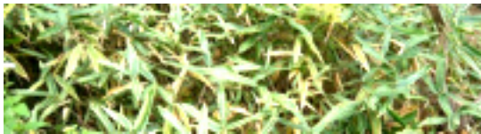
スエコザサ… 練馬区 牧野記念庭園で