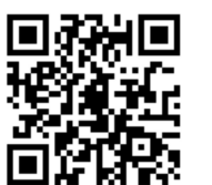
支部ホームページ